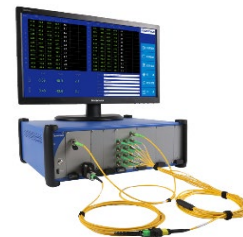
IL- og RL-tester